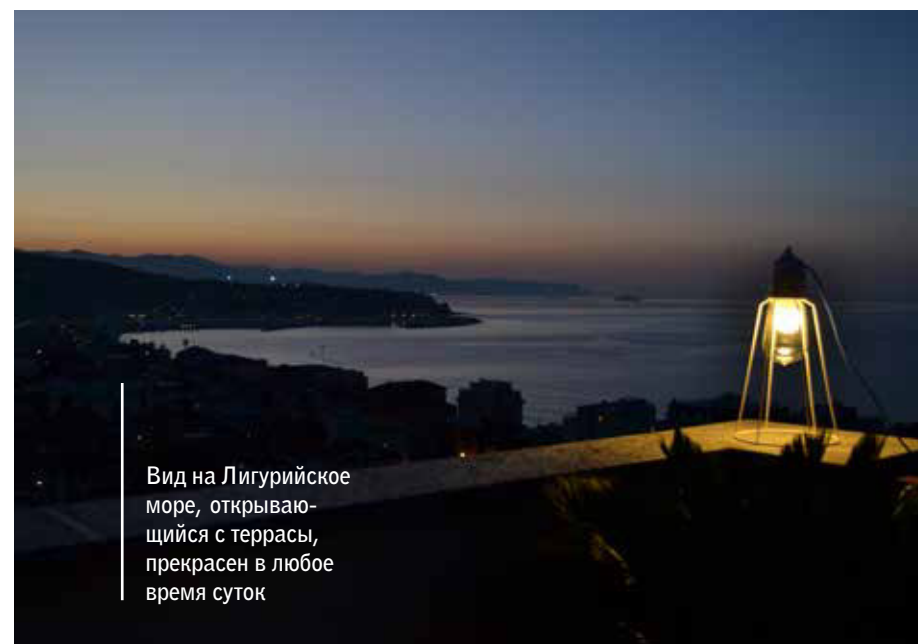
Вид на Лигурийское море, открывающийся с террасы, прекрасен в любое время суток

В интерьере много дерева — искусственно выбеленного, словно бы выжженного палящими солнечными лучами и высушенного солеными ветрами