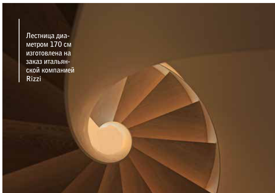
Лестница диаметром 170 см изготовлена на заказ итальянской компанией Rizzi