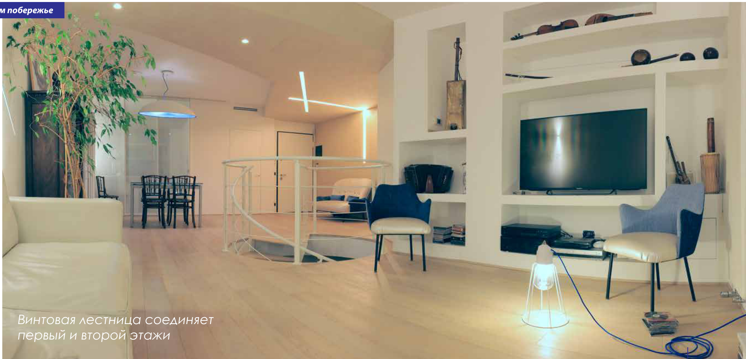
Винтовая лестница соединяет первый и второй этажи

Важнейшая роль в проекте была отведена освещению: как естественному дневному, так и искусственному. Панорамное — от пола до потолка — окно гостиной, совмещенной со столовой и небольшой кухней, выходит на море. Днем помещения залиты ослепительно-ярким солнцем и кажутся еще просторнее. Захватывающий дух вид открывается с террасы на втором этаже. Она, словно нос корабля, нависает над волнами, и хозяева, устраивая здесь семейные ужины или посиделки с друзьями, воображают себя морепла-